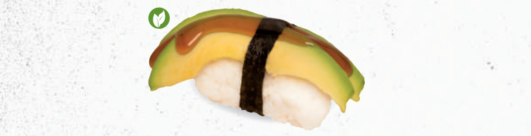
69 Avocado – 3,90 Avocado mit Teriyaki Spezielsauce A1,F