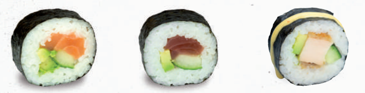
30 Sake – 9,50 Lachs D , Avocado, Gurke 31 Tekka – 9,70 Thunfisch 3,D , Avocado, Gurke 32 Tempura Chicken – 8,80 Avocado, Gurke, gebackenes Hühnerbrustfilet A1,C,F mit Mango Chili Dip K