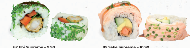
82 Ebi Supreme – 9,90 Tempura Garnele A1,B,C,F,K , Lauch, Paprika im Schnittlauch Mantel mit Yaki Tori Spezielsauce A1,F 85 Sake Supreme – 10,90 Tempura Süßkartoffel 1,8,9,A1,C,F,K , Gurke, Avocado im flambierten Lachsfilet Mantel D mit Yaki Tori Spezielsauce A1,F