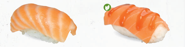
60 Sake – 3,90 frischer Lachs D 60v Vegan Sake – 4,30 veganer Lachs 1,7 mit Teriyaki Spezielsauce A1,F