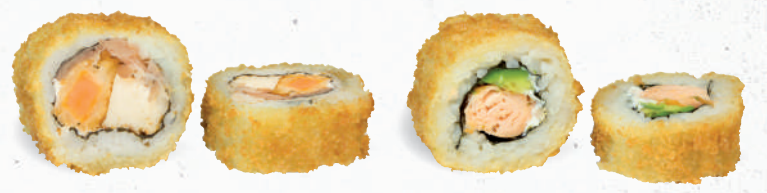
54 Crunchy Meatlovers Roll 1,A,B1,C,F,G,K,P – 10,40 gebackene Süßkartoffel, Frischkäse, gegrillte Hühnerbrust, luftgetrockneter Schinken mit Cocktailcreme C,G,K,P 55 Crunchy Syake 1,A,B1,C,D,G,P – 9,60 Stremellachsfilet, Avocado mit Sweet Chili Dip 2,3