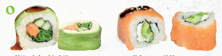
80 Veggie Spezial – 8,40 Tempura Süßkartoffel 1,8,9,A1,C,F,K , Gurke, Rucola, Frischkäse G,P im Avocado Mantel mit Teriyaki Spezielsauce A1,F 81 Supreme – 10,90 Gurke, Avocado, Frischkäse G,P im Räucherlachs Mantel D mit Unagi Spezielsauce 1,4,A1,F