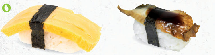
64 Tamago – 3,90 japanisches Omelette C,F,G,P 65 Unagi – 5,40 gegrillter Aal 1,A,D mit Unagi Spezielsauce A1,F