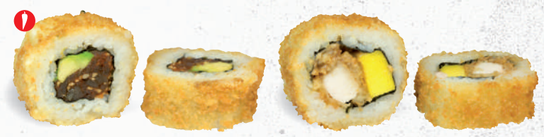
58 Crunchy Hot Tuna 1,3,4,8,9,A1,C,D,S,L – 9,60 Thunfisch (scharf mariniert), Chili, Avocado mit Sweet Chili Dip 2,3 59 Crunchy Mango Super Chicken 1,8,9,A1,C,D – 10,80 gebackenes Hühnerbrustfilet, Erdnussbutter, frische Mango mit Sweet Chili Dip 2,3