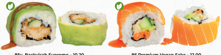
85v Backvish Supreme – 10,20 veganer Backvish 7,A,A1,C,F,G,K,P , Gurke im Avocado Mantel mit Teriyaki Spezielsauce A1,F 86 Premium Vegan Sake – 12,00 Gurke, Avocado, Möhre, Hummus L im veganen Lachsmantel 1,7 mit Teriyaki Spezielsauce A1,F