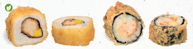
52 Crunchy Backvish 7,A,A1,C,F,G,I,K,P – 9,60 veganer Backvish, Mango mit Mango Chili Dip K 53 Crunchy Sake Hosu Maki 1,A,B,A1,C,D,L – 6,50 gebackener Lachs, Hummus mit Sweet Chili Dip 2,3