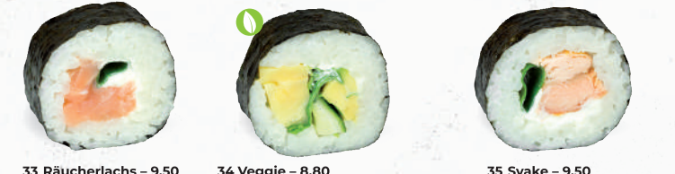
33 Räucherlachs – 9,50 Räucherlachs D , Lauch, Frischkäse G,P 34 Veggie – 8,80 Tamago (jap. Omelette) C,F,G,P , Gurke, Avocado, Rucola, Frischkäse G,P 35 Syake – 9,50 Stremellachs D , Lauch, Frischkäse G,P