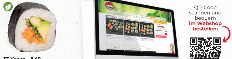
37 Vegan – 8,40 Avocado, Gurke, Möhre, gebackene Süßkartoffel B,A1,F , Rucola, Hummus L