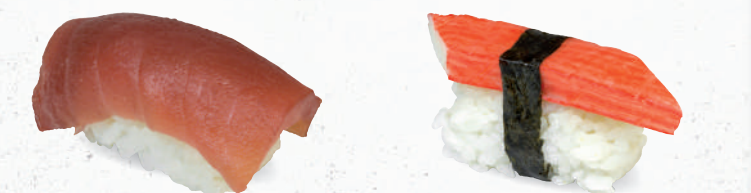
61 Tekka – 5,40 frischer Thunfisch 3,D 62 Kani – 4,00 Surimi