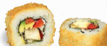
56 Crunchy Chicken 1,8,9, A1, C, F, G, P – 10,10 gegrilltes Hühnerbrustfilet, Paprika, Frischkäse, Avocado mit Sweet Chili Dip 2,3