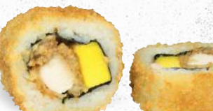
59 Crunchy Mango Super Chicken 1,8,9, A1, C, H2 – 11,40 gebackenes Hühnerbrustfilet, Erdnussbutter, frische Mango mit Sweet Chili Dip 2,3