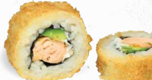
55 Crunchy Syake 1,8,9, A1, C, D, F, G, P – 10,20 Stremellachsfilet, Frischkäse, Avocado mit Sweet Chili Dip 2,3