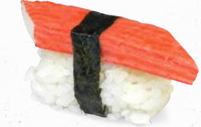
62 Kani – 4,20 Surimi 1,1, A1, B, C, D, F