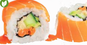
86 Premium Vegan Sake – 12,60 Gurke, Avocado, Möhre, Hummus L im veganen Lachsmantel 1,7 mit Teriyaki Spezialsauce A1,F