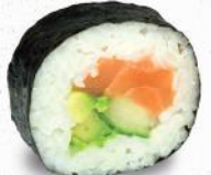
30 Sake – 10,10 Lachs D, Avocado, Gurke

je 8 Stück – große Rolle in Seetangpapier