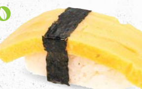
64 Tamago – 4,20 japanisches Omelette C, F, G, P