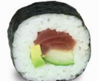
31 Tekka – 10,30 Thunfisch 3,D, Avocado, Gurke