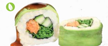
80 Veggie Spezial – 9,40 Tempura Süßkartoffel 1,8,9, A1, C, F, K, Gurke, Rucola, Frischkäse G, P im Avocado Mantel mit Teriyaki Spezialsauce A1,F

je 8 Stück – umgekehrte Reisrolle im Mantel