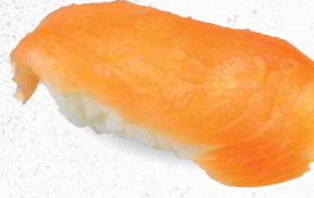
68 Räucherlachs – 4,70 Avocado 3,D