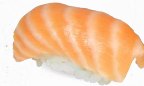
60 Sake – 4,20 frischer Lachs 3,D