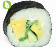
34 Veggie – 9,30 Tamago (jap. Omelette) C, F, G, P, Gurke, Avocado, Rucola, Frischkäse G, P