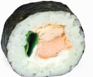
35 Syake – 10,10 Stremellachs D, Lauch, Frischkäse G, P