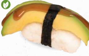
69 Avocado – 4,20 Avocado mit Teriyaki Spezialsauce A1,F