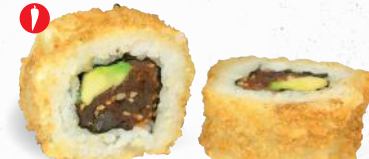
58 Crunchy Hot Tuna 1,3,4,8,9, A1, C, D, F, L – 10,20 Thunfisch (scharf mariniert), Chili, Avocado mit Sweet Chili Dip 2,3