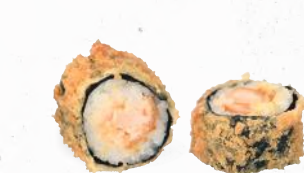
53 Crunchy Sake Hosu Maki 1,8,9, A1, C, D, L – 7,00 gebackener Lachs, Hummus mit Sweet Chili Dip 2,3