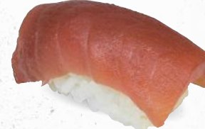
61 Tekka – 5,80 frischer Thunfisch 3,D