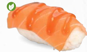
60v Vegan Sake – 5,20 vegane Lachs 1,7 mit Teriyaki Spezialsauce A1,F