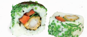
82 Ebi Supreme – 10,40 Tempura Garnele A1, B, C, F, K, Lauch, Paprika im Schnittlauch Mantel mit Yaki Tori Spezialsauce A1,F