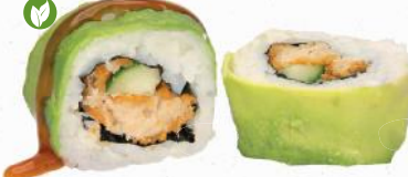
85v Backfisch Supreme – 10,80 vegane Backfisch 7,4, A1, C, F, G, K, P, Gurke im Avocado Mantel mit Teriyaki Spezialsauce A1,F