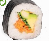
37 Vegan – 8,90 Avocado, Gurke, Möhre, gebackene Süßkartoffel A1, F, Rucola, Hummus L