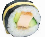
32 Tempura Chicken – 9,30 Avocado, Gurke, gebackenes Hühnerbrustfilet A1, C, F mit Mango Chili Dip *