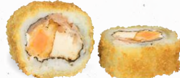
54 Crunchy Meatlovers Roll 1,8, A1, C, F, G, K, P – 11,00 gebackene Süßkartoffel, Frischkäse, gegrillte Hühnerbrust, luftgetrockneter Schinken mit Cocktailcreme C, G, K, P