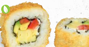
57 Crunchy Veggie 1,8,9, A1, C, F, G, P – 10,00 Tamago, Paprika, Frischkäse, Avocado mit Sweet Chili Dip 2,3