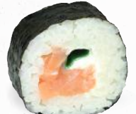
33 Räucherlachs – 10,10 Räucherlachs D, Lauch, Frischkäse G, P