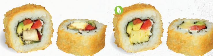
56 Crunchy Chicken 1,8,9,A1,C,F,G,P – 9,20 gegrilltes Hühnerbrustfilet, Paprika, Frischkäse, Avocado mit Sweet Chili Dip 2,3