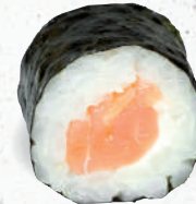
23 Räucherlachs – 5,20 Räucherlachs D, Frischkäse G,P