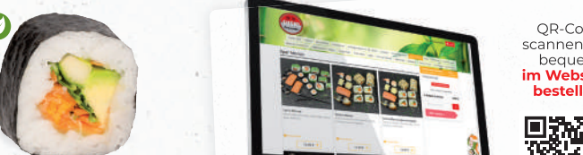
37 Vegan – 8,00 Avocado, Gurke, Möhre, gebackene Süßkartoffel B,A1,F , Rucola, Hummus L