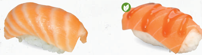
60 Sake – 3,70 frischer Lachs D