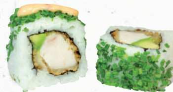
47 Tempura Chicken – 7,30 Avocado, gebackenes Hühnerbrustfilet A1,C,F im Schnittlauch Mantel mit Cocktail Creme C,G,K,P