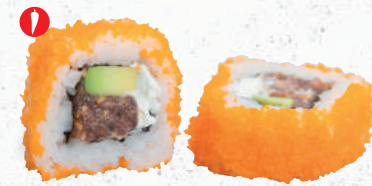
42 Spicy Tekka – 8,80 Thunfisch (scharf mariniert) 3,D,1, Avocado, Frischkäse G,P im Fischrogen Mantel 1