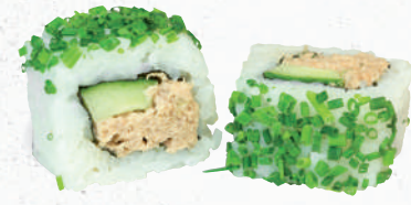
48 Tuna – 6,70 Thunfischsalat 1,2,4,9,A1,C,D,F,G,I,K,P, Gurke im Schnittlauch Mantel