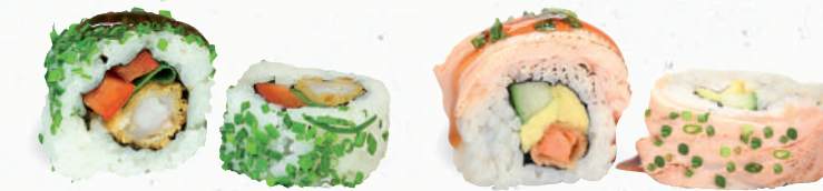
82 Ebi Supreme – 9,40 Tempura Garnele A1,B,C,F,K , Lauch, Paprika im Schnittlauch Mantel mit Yaki Tori Spezielsauce A1,F