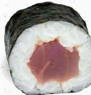
21 Tekka – 6,50 frischer Thunfisch 3,D