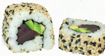
41 Tekka – 7,80 frischer Thunfisch 3,D, Avocado im Sesam Mantel 1