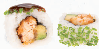
40a Tempura Sake – 7,80 gebackener Lachs A1,D,F, Avocado im Schnittlauch Mantel mit Teriyaki Spezielsauce A1,F