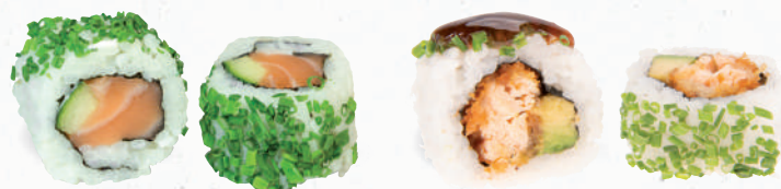
40 Sake – 7,40 frischer Lachs D, Gurke im Schnittlauch Mantel