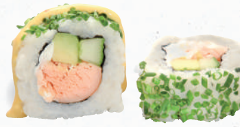
49 Syake – 7,40 Stremellachs D, Gurke, Avocado, Frischkäse G,P im Schnittlauch Mantel mit Mango Chili Dip K