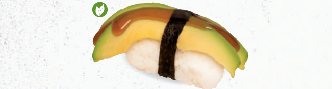
69 Avocado – 3,70 Avocado mit Teriyaki Spezielsauce A1,F