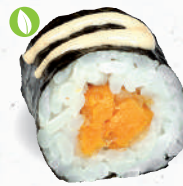
15 Tempura Süßkartoffel – 4,10 gebackene Süßkartoffel 8,A1,C,F mit Cocktail-Creme C,G,K,P