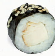
27 Yaki Tori – 5,20 Hühnchen, Sesam 1, mit Yaki Tori Spezielsauce A1,F