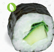
12 Hassel – 4,60 Gurke, Frischkäse G,P, Lauch