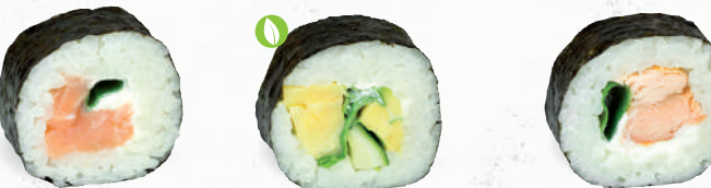
33 Räucherlachs – 9,00 Räucherlachs D , Lauch, Frischkäse G,P