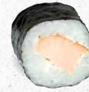
29 Syake – 5,20 Stremellachs D, Frischkäse G,P