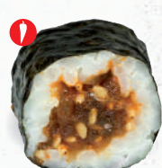
25 Spicy Tekka – 5,80 Thunfisch 3,D,1 scharf mariniert