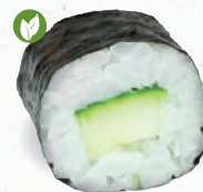
10 Kappa – 3,70 Gurke

je 8 Stück – kleine Rolle in Seetangpapier