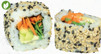
45 Fitness – 6,70 Avocado, Möhre, Hummus 1, Rucola im Sesam Mantel 1