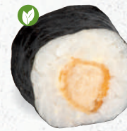
17 Backfisch – 5,00 veganer Backfisch 7,A,A1,C,F,G,I,K,P, Hummus 1