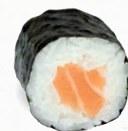
20 Sake – 5,20 frischer Lachs D