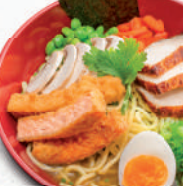
R3 Surf'n Turf 2,3,A,C,F,K – 10,90 Tempura Lachs, Hühnerbrust, Paprika, Edamame, Ei, Champignons, Noriblätter, Frühlingzwiebeln, Koriander