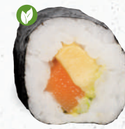
16 Vegan Sake Avocado – 5,30 veganer Lachs 1,7, Avocado