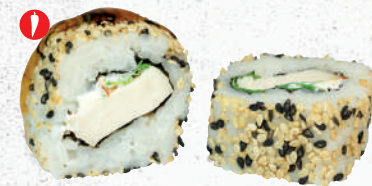
46 Chicken Peri Peri – 6,80 Rucola, Chili, gegrilltes Hühnerbrustfilet, Frischkäse G,P im Sesam Mantel 1 mit Yaki Tori Spezielsauce A1,F