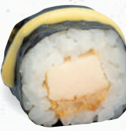
28 Tempura Chicken – 5,20 gebackenes Hühnerbrustfilet A1,C,F mit Mango Chili Dip K