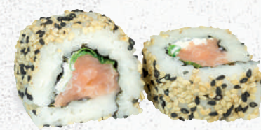
44 Räucherlachs – 7,70 Räucherlachs D, Rucola, Frischkäse G,P, im Sesam Mantel 1