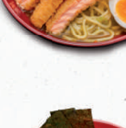
R2 Chikin A1,C,F – 9,90 Hühnerbrust, Paprika, Edamame, Champignons, Frühlingzwiebeln, Ei, Noriblätter, Koriander