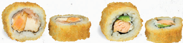
54 Crunchy Meatlovers Roll 1,8,A1,C,F,G,K,P – 9,90 gebackene Süßkartoffel, Frischkäse, gegrillte Hühnerbrust, luftgetrockneter Schinken mit Cocktailcreme C,G,K,P