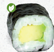
14 Avocado – 4,60 Avocado