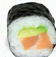
24 Sake Avocado – 5,20 frischer Lachs D, Avocado