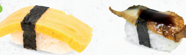
64 Tamago – 3,70 japanisches Omelette C,F,G,P