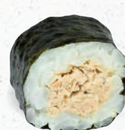
26 Tuna – 5,20 Thunfischsalat 1,2,4,9,A1,C,D,F,G,I,K,P