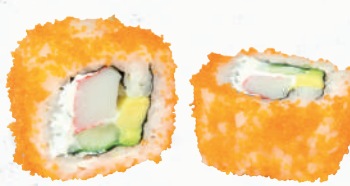
43 California – 7,80 Surimi 11,8, Avocado, Gurke, Frischkäse G,P im Fischrogen Mantel 1