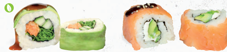
80 Veggie Spezial – 8,00 Tempura Süßkartoffel 1,8,9,A1,C,F,K , Gurke, Rucola, Frischkäse G,P im Avocado Mantel mit Teriyaki Spezielsauce A1,F

je 8 Stück – umgekehrte Reisrolle im Mantel