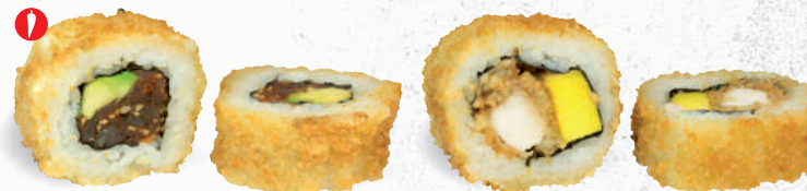
58 Crunchy Hot Tuna 1,3,4,8,9,A1,C,D,E,L – 9,20 Thunfisch (scharf mariniert), Chili, Avocado mit Sweet Chili Dip 2,3