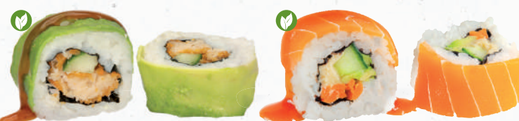
85v Backvish Supreme – 9,70 veganer Backvish 7,A,A1,C,F,G,I,K,P , Gurke im Avocado Mantel mit Teriyaki Spezielsauce A1,F