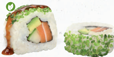
40v Vegan Sake – 7,80 veganer Lachs 1,7, Gurke, Avocado im Schnittlauch Mantel mit Teriyaki Spezielsauce A1,F