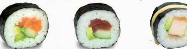
30 Sake – 9,00 Lachs D , Avocado, Gurke

je 8 Stück – große Rolle in Seetangpapier