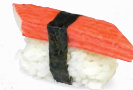
62 Kani – 4,00 Surimi 1,1,ALB,C,D,F