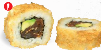
58 Crunchy Hot Tuna 1,3,4,8,9,ALC,D,F,L – 9,70 Thunfisch (scharf mariniert), Chili, Avocado mit Sweet Chili Dip 2,3