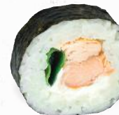
35 Syake – 9,60 Stremellachs P, Lauch, Frischkäse GP