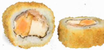
54 Crunchy Meatlovers Roll 1,8,ALCF,G,I,K,P – 10,40 gebackene Süßkartoffel, Frischkäse, gegrillte Hühnerbrust, luftgetrockneter Schinken mit Cocktailcreme C,G,K,P