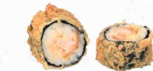
53 Crunchy Sake Hosho Maki 1,8,9,ALC,D,L – 6,60 gebackener Lachs, Hummus mit Sweet Chili Dip 2,3