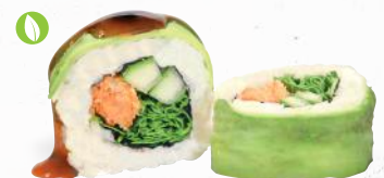
80 Veggie Spezial – 8,90 Tempura Süßkartoffel 1,8,9,ALC,F,K, Gurke, Rucola, Frischkäse GP im Avocado Mantel mit Teriyaki Spezialsaucen ALF

je 8 Stück – umgekehrte Reisrolle im Mantel