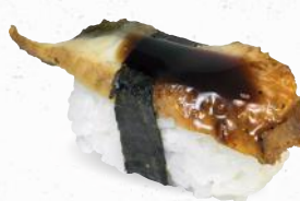
65 Unagi – 5,50 gegrillter Aal 1,A,D mit Unagi Spezialsaucen ALF