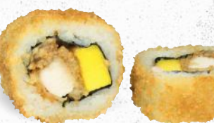
59 Crunchy Mango Super Chicken 1,8,9,ALC,D,L – 10,80 gebackenes Hühnerbrustfilet, Erdnussbutter, frische Mango mit Sweet Chili Dip 2,3