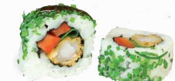
82 Ebi Supreme – 9,90 Tempura Garnele 1,ALB,C,F,K, Lauch, Paprika im Schnittlauch Mantel mit Yaki Tori Spezialsaucen ALF