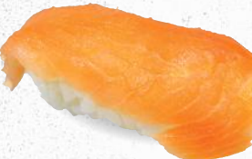
68 Räucherlachs – 4,40 Avocado 3,D