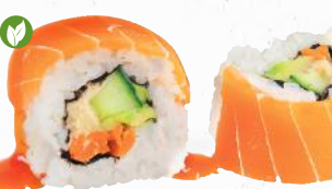
86 Premium Vegan Sake – 12,00 Gurke, Avocado, Möhre, Hummus L im veganen Lachsmantel 1,7 mit Teriyaki Spezialsaucen ALF