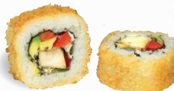
56 Crunchy Chicken 1,8,9,ALCF,G,P – 9,60 gegrilltes Hühnerbrustfilet, Paprika, Frischkäse, Avocado mit Sweet Chili Dip 2,3