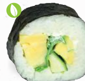
34 Veggie – 8,80 Tamago (jap. Omelette) C,F,G,P, Gurke, Avocado, Rucola, Frischkäse GP