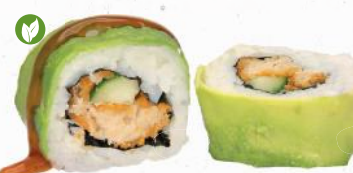
85v Backvisch Supreme – 10,20 vegane Backvisch 7,A,ALCF,G,I,K,P, Gurke im Avocado Mantel mit Teriyaki Spezialsaucen ALF