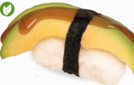
69 Avocado – 4,00 Avocado mit Teriyaki Spezialsaucen ALF