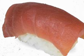
61 Tekka – 5,50 frischer Thunfisch 3,D