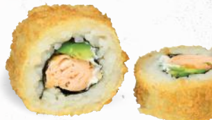
55 Crunchy Syake 1,8,9,ALC,D,F,G,P – 9,70 Stremellachsfilet, Frischkäse, Avocado mit Sweet Chili Dip 2,3