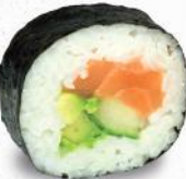
30 Sake – 9,60 Lachs P, Avocado, Gurke

je 8 Stück – große Rolle in Seetangpapier