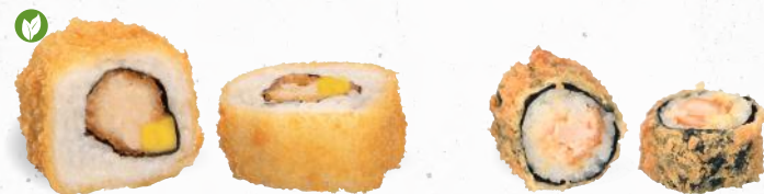
52 Crunchy Backvisch 7,A,ALCF,G,I,K,P – 9,60 vegane Backvisch, Mango mit Mango Chili Dip K

je 8 Stück – im knusprigen Tempura Mantel