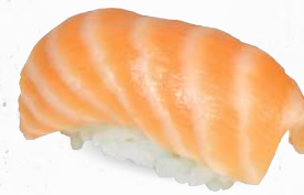
60 Sake – 4,00 frischer Lachs P