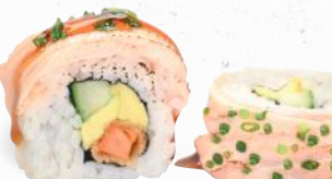
85 Sake Supreme – 11,00 Tempura Süßkartoffel 1,8,9,ALC,F,K, Gurke, Avocado im flambierten Lachsfilet Mantel D mit Yaki Tori Spezialsaucen ALF