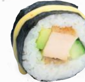
32 Tempura Chicken – 8,80 Avocado, Gurke, gebackenes Hühnerbrustfilet 1,ALCF mit Mango Chili Dip K