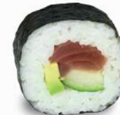
31 Tekka – 9,80 Thunfisch 3,D, Avocado, Gurke