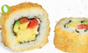
57 Crunchy Veggie 1,8,9,ALCF,G,P – 9,50 Tamago, Paprika, Frischkäse, Avocado mit Sweet Chili Dip 2,3