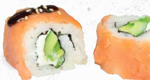
81 Supreme – 11,00 Gurke, Avocado, Frischkäse GP im Räucherlachs Mantel D mit Unagi Spezialsaucen 1,4,ALF